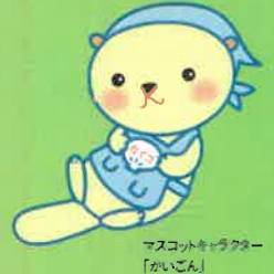
マスコットキャラクター 「かいこん」